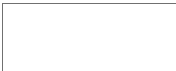
Pieczętka firmowa Wykonawcy